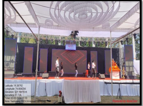
Students performing group dance