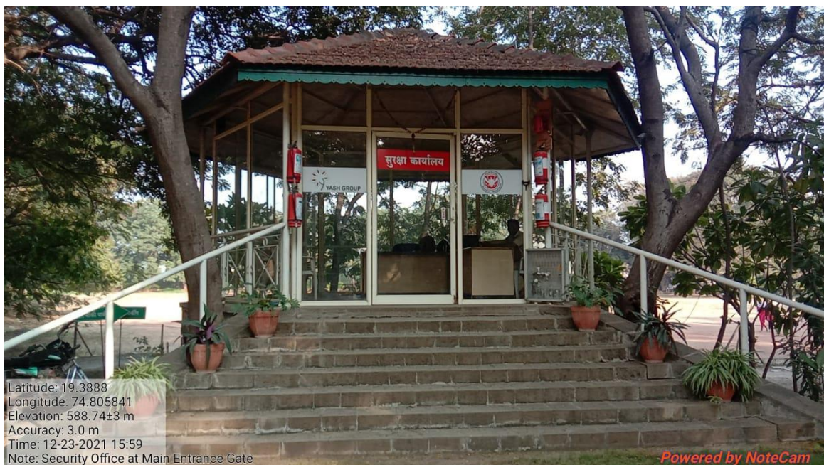
Security Office at Main Entrance Gate