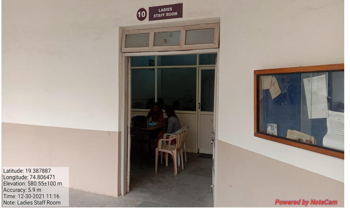
Ladies Staff Room