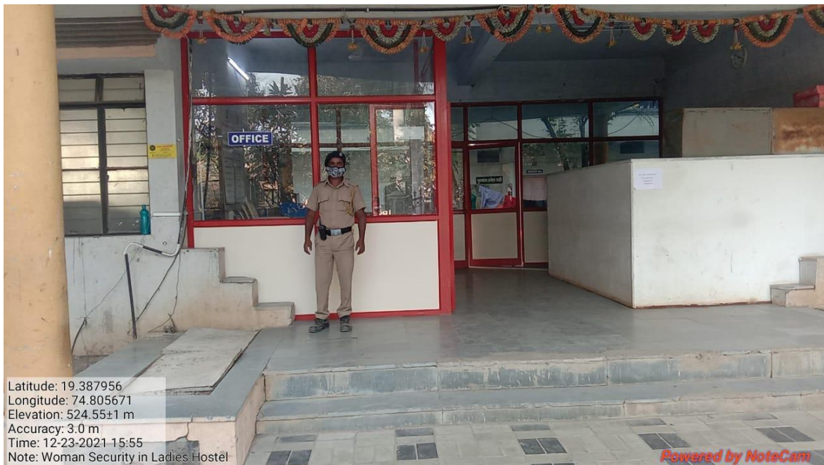
Women's Facilities: Security in Ladies Hostel

Geo tagged photographs with captions and date: