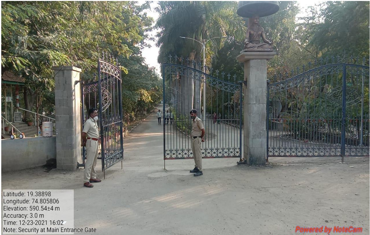
Security at Main Entrance Gate