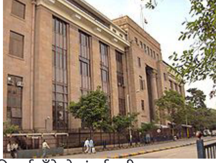
रिझर्व बँकेचे मुंबईमधील मुख्यालय

ब्रिटिशांनी त्यांच्या राजवटीत भारतात नागरी सेवा, भारतीय रिझर्व बँक, भारतीय रेल्वे अशा बऱ्याच सेवा चालू केल्या होत्या, स्वातंत्र्यानंतर भारतात त्या सेवा पुढे चालू राहिल्या. मुंबई ही भारताची आर्थिक राजधानी मानली जाते. भारतीय रिझर्व बँक, बॉम्बे स्टॉक एक्स्चेंज, आणि नॅशनल स्टॉक एक्स्चेंज ह्या महत्त्वाच्या संस्थांची मुख्यालये मुंबईत आहेत. तसेच बऱ्याच इतर खाजगी व सार्वजनिक वित्तसंस्थांची मुख्यालयेही मुंबईत आहेत.